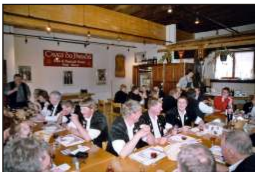
Der Jodlerclub St. Stephan bei uns zu Besuch...

Für Ihren Verein, Ihre Gäste, bzw. Ihre Freunde können wir auf Reservation ein Aperitif, eine Degustation, ein Walliser-Z'vieri (max. 45 Pers.) oder ein Raclette-Schmaus (max. 15 Pers.) organisieren. Wenn erwünscht zeigen wir Ihnen auf Grossleinwand gerne unseren Film "Vom Rebstock zur Flasche" (ca. 20 min.).