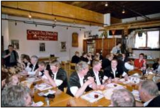
Le "Jodlerclub St. Stephan" en visite chez nous...

Pour vos sorties de société, vos hôtes ou tout simplement pour votre plaisir, nous vous organisons volontiers sur réservation: un apéritif, une dégustation, des 4 heures valaisans (max. 45 pers.), ou une raclette (max. 15 pers.). Si vous le souhaitez, vous pourrez également assister à la projection sur grand écran de notre film "De la vigne à la bouteille" (env. 20 min.).