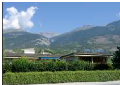
Les CAVES DU PARADIS aux pieds des Coteaux de Sierre

Les crus des CAVES DU PARADIS sont régulièrement couronnés de médailles, de diplômes nationaux et internationaux.